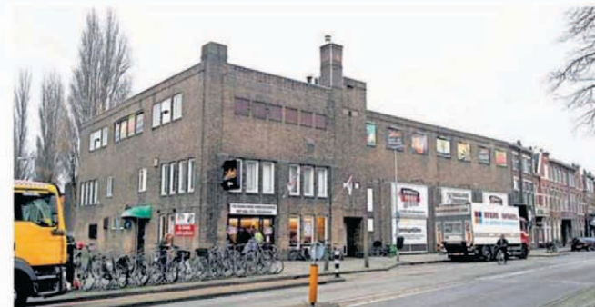
Het voormalige kegelpaleis aan de Tempeliersstraat.