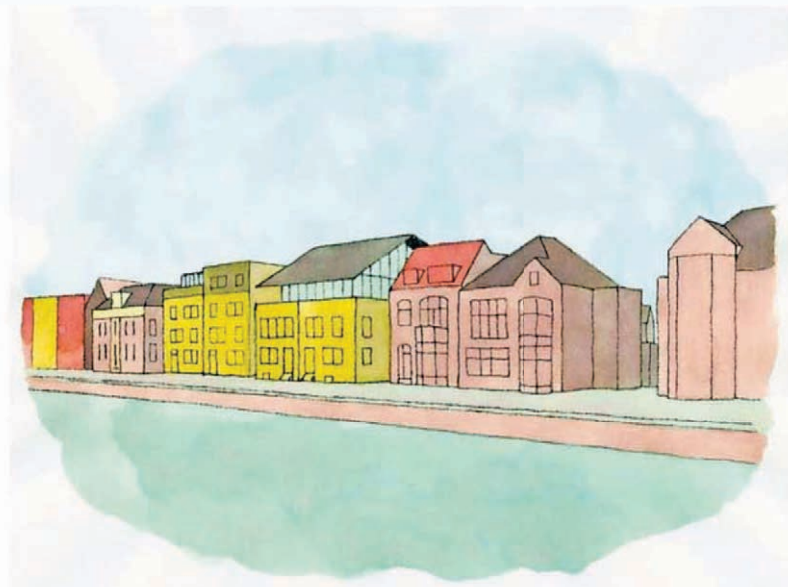
In het lichtgeel een impressie van de nieuwbouw langs de Raamsingel.