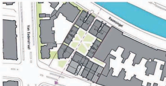
De nieuwbouw ligt rond het vierkante groene hof.